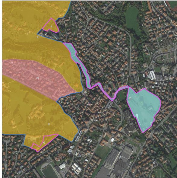
Proposta azzonamento Variante PTCP