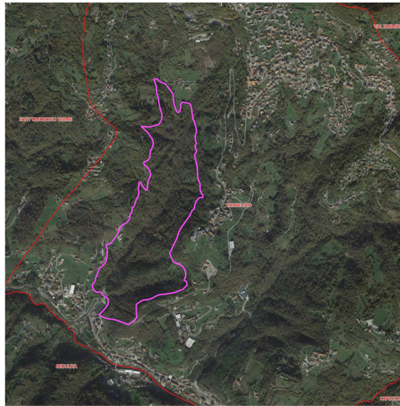
Inquadramento su ortofoto